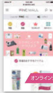
オンラインショップ