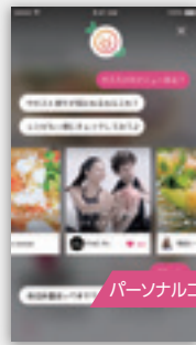
パーソナルコーチAI