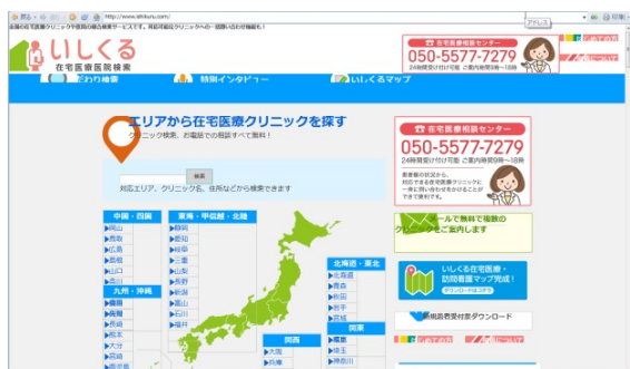
※『いしくる』の特徴はこちらをご確認ください。 http://www.ishikuru.com/cc/begginer.html

2017年1月30日より、SBI生命のウェブサイトに『いしくる』のバナーを掲載すると同時に、エムスリードクターサポートが運営する『いしくる』にSBI生命の終身医療保険「も。」のバナーを掲載するなど、相互に情報・サービスを提供いたします。また今後、双方で協力して在宅医療の認知向上、普及に向けて取り組んでまいります。