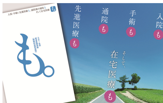
※SBI生命の「も。」の特徴はこちらをご確認ください。 http://www.sbilife.co.jp/products/medical-Mo/